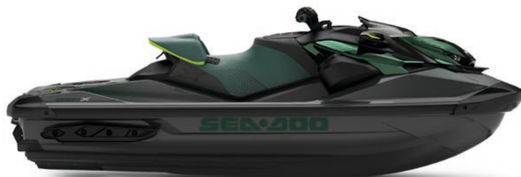
● NYHET Racing Grön